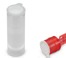
Provetta Tappo del reagente