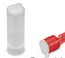
Tubo de muestra Tapón del reactivo